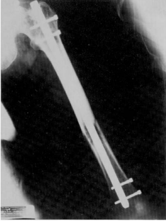
Resim 3b: Hastaya açık yöntemle kilitli Küntscher çivisi ve PMMA uygulanmış olup 6 ay sonra hasta kaybedilmiştir (Operasyon sırasında, PMMA içine radyopak madde konulmadığı için radyolojik olarak görüntü vermemiştir).

Humerus diafizinde metastatik kırığı saptanan ve Rush pin ve otogreft uygulanan 72 yaşındaki meme kanseri metastazlı bir olguda, 6 ay sonra, non-union nedeniyle pinler çıkartılarak tümör rezeksiyon protezi uygulanmış; ancak hasta kısa bir zaman sonra kaybedilmiştir.