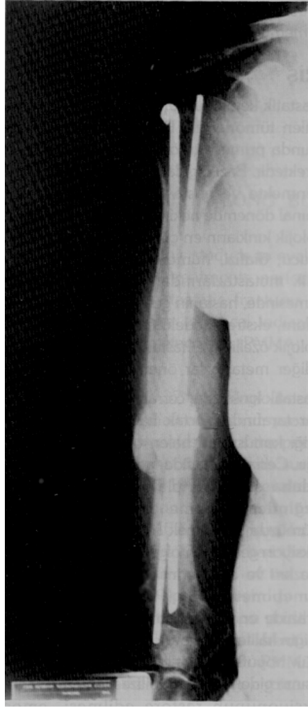
Resim 1b: Beklenen yaşam süresinin kısa olması nedeniyle, sadece humerusa açık intramedüller fiksasyon ve PMMA uygulanmış ve hasta, operasyondan 3 ay sonra kaybedilmiştir.

proksimalinde akciğer kanserine bağlı metastatik kırık bulunan bir olguda, lezyon eksize edilerek parsiyel omuz protezi yerleştirilmiştir. Bu olguda kırık, primer tümör tanısından önce oluşmuştur. Humerus diafiz kırığı nedeniyle opere edilen toplam 13 olgunun 2'sinde daha bu olgudaki gibi hasta, primer tümör tanısı konmadan kırık nedeniyle başvurmuştur.