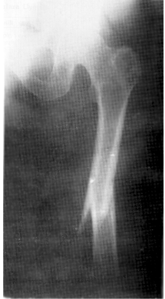
Resim 3a: Her iki femur difizinde multipl miyeloma bağlı patolojik kırık bulunan hastanın sol femur preoperatif grafisi.

Bilateral femur kırığı bulunan multipl miyelomlu diğer bir olguda ise bilateral kilitleli Küntscher çivisiyle fiksasyon yapılmıştır. Ender çivisi kullanılan olgu dışındaki tüm olgularda PMMA kullanılmış olup, yine bu olgu dışındaki olgularda lokal metastaz kontrolü ve ağrıyı gidermek için radikal amaçla cerrahi tedavi uygulanmıştır. İki olguda, primer tümör, kırık nedeniyle başvurusundan sonra ortaya konmuştur.