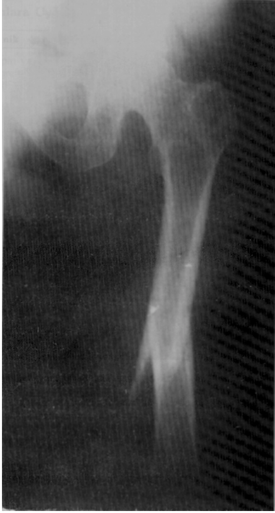
Resim 2: Sağ femur proksimal uç ve diafizinde meme kanseri metastazı nedeniyle total tümör rezeksiyon protezi uygulanmış bir hastanın postoperatif grafisi.