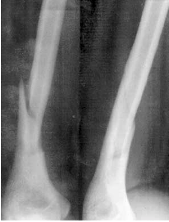
Resim 3: Kırık oluştuktan 7 gün sonra, breys uygulandıktan sonraki grafi.