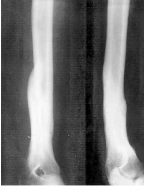
Resim 4: Kırık iyileşmesi tamamlandıktan sonra, 5. ay sonundaki grafi.