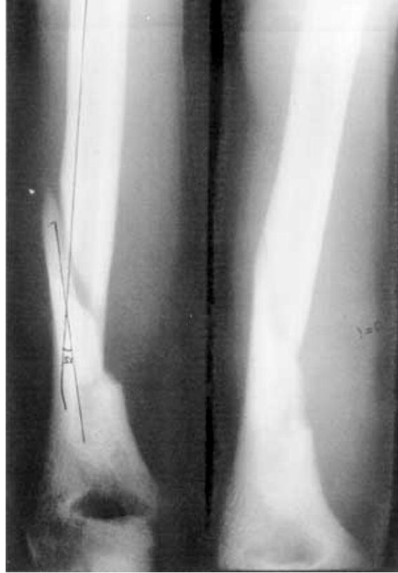
Resim 2: Kapalı, spiral, distal humerus shaft kırıklısı 26 yaşındaki bir hastanın başlangıç grafisi.