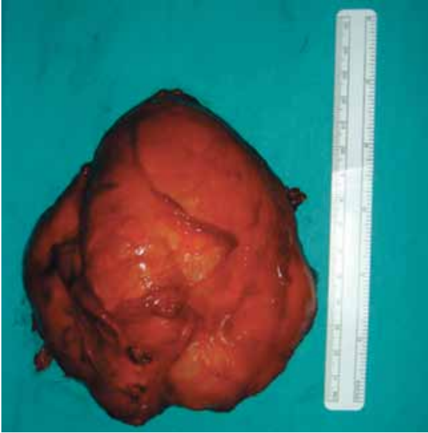
Şekil 4. Yaklaşık 15x10x10 cm boyutlarındaki çıkarılan kitlenin makroskopik görünümü.

ve içerisinde çok sayıda kız veziküllerin olduğu görüldü (Şekil 5). Kitlenin histopatolojik incelemesi de kist hidatik ile uyumlu bildirildi. Ameliyat sonrası dönemde akıntı, enfeksiyon gibi yara sorunları ile karşılaşmadı. Hastaya 15 mg/kg/gün albendazol tedavisi üç ay süresince devam edildi. Hastanın birinci ve ikinci yıl kontrolünde yakınmalarının tamamen geçtiği görüldü ve herhangi bir nükse rastlanmadı.