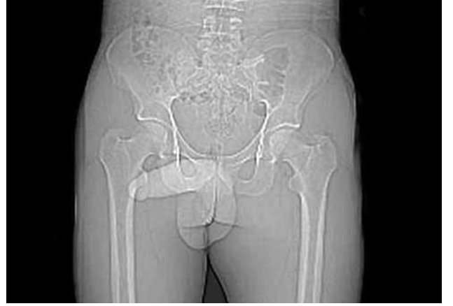
Şekil 2. Çekilen direk pelvis radyografisinde sol taraftaki yumuşak doku şişliğinin görünümü.

Direkt radyografide femur medialinde yumuşak doku şişliği dışında herhangi bir bulguya rastlanmadı (Şekil 2). Laboratuvar incelemelerinde tam kan sayımı, eritrosit sedimentasyon hızı, idrar ve kan biyokimya parametreleri normal sınırlarda idi. Kan kist hidatik serolojik testi negatif idi. Manyetik rezonans görüntüleme cilt altından başlayıp sağ uyluk medial adduktör kas grubu içerisinde yerleşmiş proksimalde inguinal bölgeye kadar uzanım gösteren multiloküle