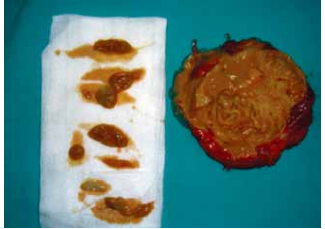
Şekil 5. Kitle ortasından kesildikten sonra içerisindeki kız veziküller ve kist duvarındaki germinatif membranın görünümü.

Kist hidatik, sağlık önlemlerinin düşük olduğu koyun yetiştirilen ve köpek bakımının kontrolsüz olduğu bölgelerde daha yüksek oranda görülür. [1] E. granulosus 'un kesin konakçıları köpek, kurt, tilki gibi etçil hayvanlardır. Köpekler kontrolsüz bir şekilde kist hidatik'li koyun organlarını yediklerinde enfekte olurlar. Köpek bağırsaklarına yerleşen E. granulosus larva yaymaya başlar ve dışkı yoluyla bu larvalar çevreye yayılır. İyi yıkanmamış besinler yoluyla veya köpekle yakın temas yoluyla insana geçen larvalar duodenum mukozasını geçerek dolaşıma girer. Larvaların çoğu karaciğeri geçemez, bu nedenle en sık karaciğerde