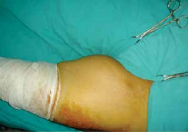
Şekil 1. Uylukta şişlik yakınması ile gelen hastada sol uyluk medialinde yaklaşık 25x15 cm boyutlarındaki kitlenin görünümü.

büyüdüğünü ancak beraberinde ağrı gibi başka bir yakınmasının olmadığını belirtti. Fizik muayenede sol uyluk medialinde adduktör kas grubu içerisinde proksimalde kasığa kadar uzanım gösteren, fluktuasyon veren, ağrısız, yumuşak kıvamda, immobil yaklaşık 25x15 cm boyutlarında kitle saptandı (Şekil 1). Hastanın genel durumu iyiydi, kilo kaybı, geçirilmiş hastalık ve travma öyküsü, ateş gibi ek sistemik bir sorunu yoktu.